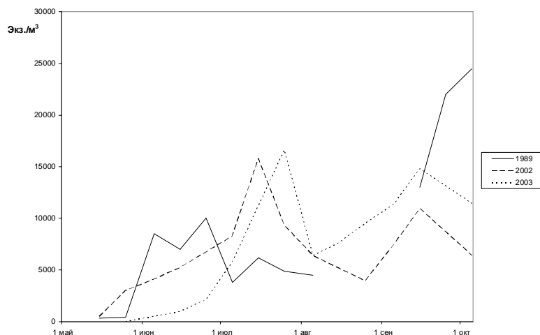
Рис. 3. Сезонная динамика численности копепоидов S. tenellus в 1989, 2002 и 2003 гг.